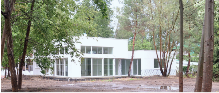
Rycina 1.1. Budynek, który stał się inspiracją dla projektu ogrodu w stylu modernistycznym, Zalesie Dolne koło Warszawy (fot. 2016)

Tak wiele się od tamtych czasów zmieniło. W architekturze i sztuce pojawiły się: postmodernizm, dekonstruktywizm, konceptualizm czy naturyzm. Zaistniały nowe formy tworzenia w przestrzeni: happening, performance czy land art. Na rynek weszły nowe technologie, rozwinął się Internet.