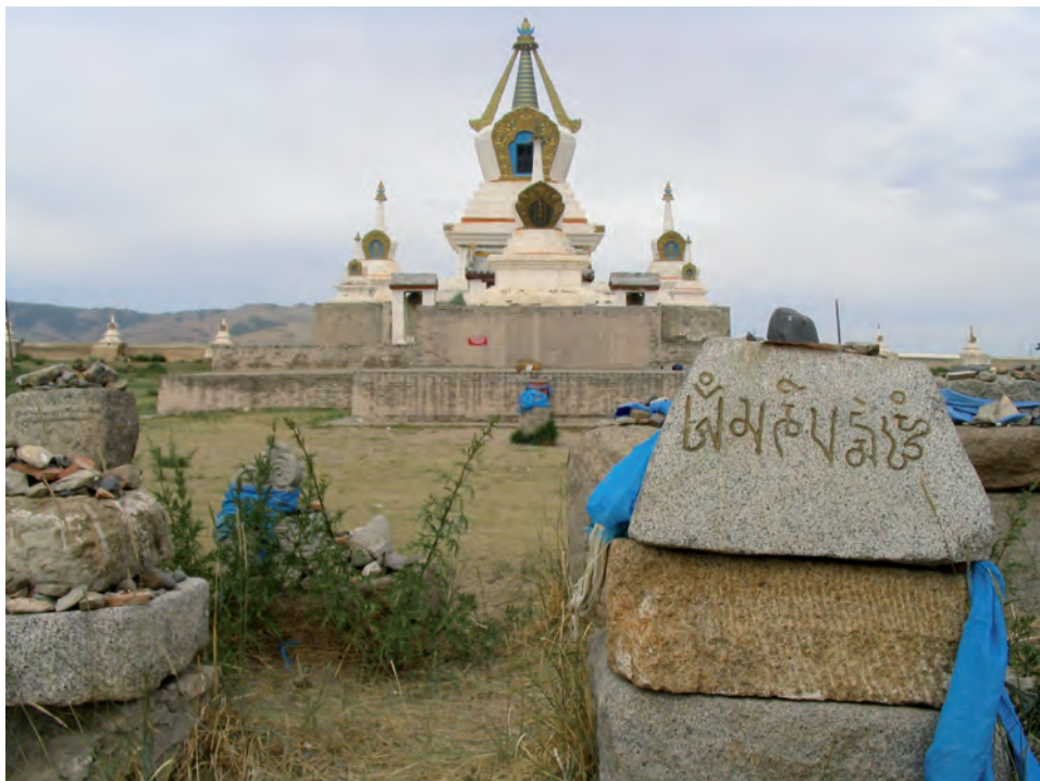
Ryc. 1.5. Kurhany w Azji: suburgan w kompleksie świątynnym Karakorum w Mongolii