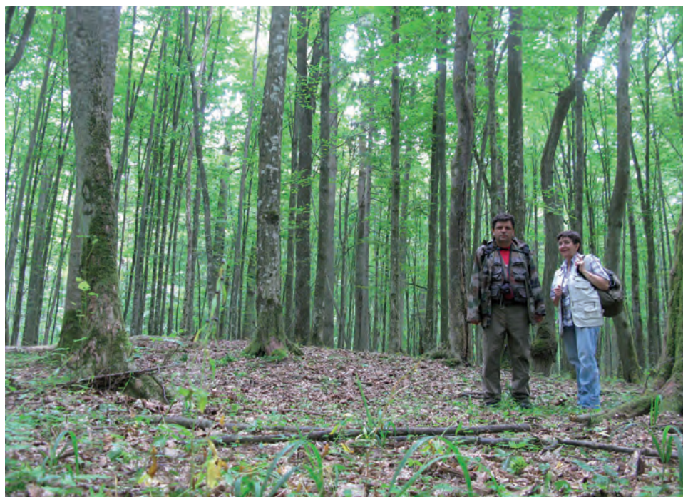
Ryc. 1.3. Środkowa Europa: kurhan w polskiej części Puszczy Białowieskiej