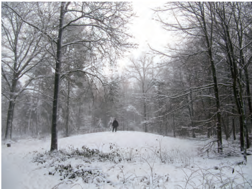
Ryc. 1.1. Zachodnia Europa: kurhan w Exloo, Holandia