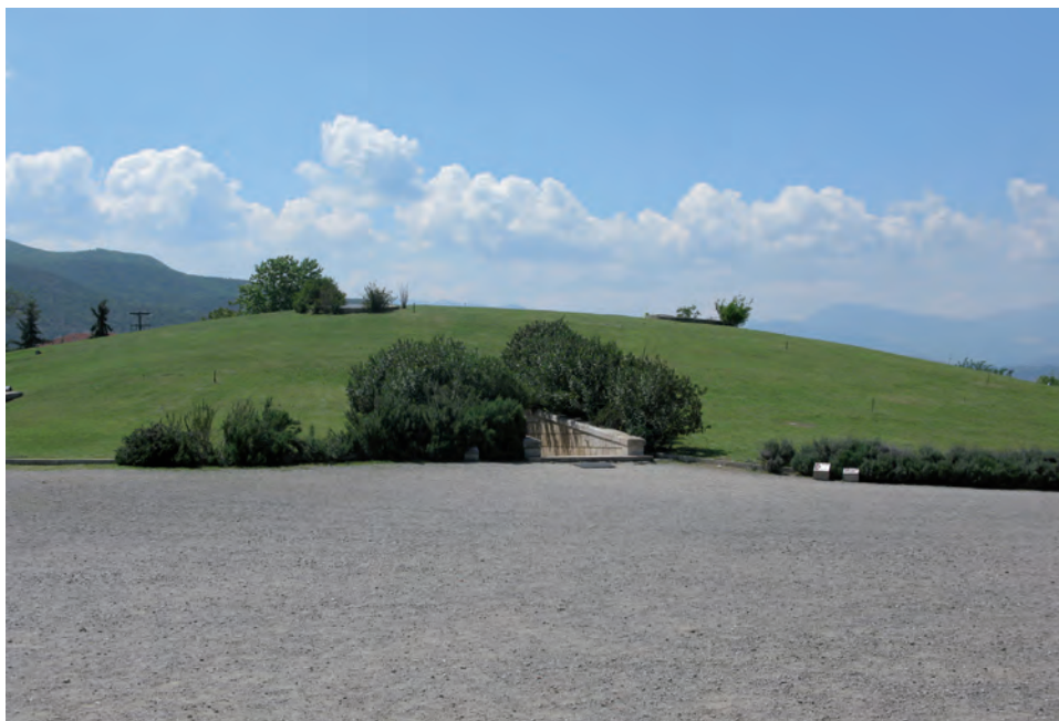
Ryc. 1.2. Południowa Europa: kurhan Filipa Macedońskiego w Verginie, Grecja