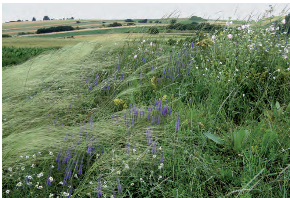
Ryc. 1.4. Środkowa Europa: kurhan na Pogórze Proszowickim, Lubinówka koło Bejs