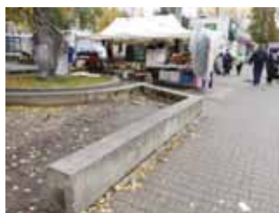
Ryc. 24. Murek, na którym siadają ludzie, przy ul. Międzynarodowej