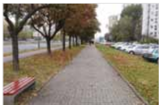
Ryc. 18. Ulica Broniewskiego, na odcinku około 600 m rozmieszczono w równych odstępach kilka ławek