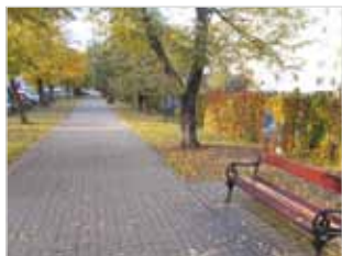
Ryc. 12. Ławki przy ul. Dzikiej