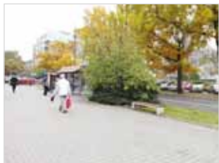
Ryc. 15. Ławka przy ul. Międzynarodowej