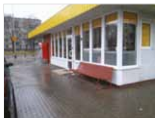
Ryc. 5. Ławka przy ul. Szczęśliwickiej