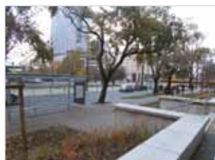
Ryc. 23. Miejsca do siedzenia – przystanek, murki przy ul. Stawki