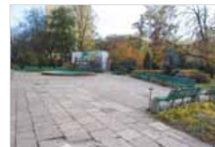
Ryc. 11. Ławki przy ul. Stawki, teren Wydziału Psychologii UW