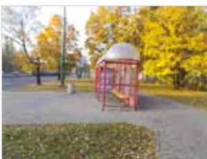
Ryc. 22. Wiata przystankowa z ławką przy al. Jana Pawła II