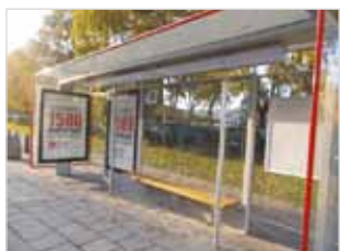
Ryc. 21. Wiata przystankowa z ławką przy ul. Stawki