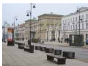
Ryc. 17. Ławki przy ul. Krakowskie Przedmieście