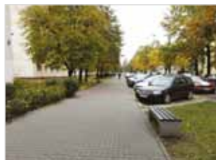
Ryc. 14. Ławka przy ul. Międzynarodowej