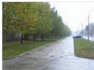
Ryc. 28. Brak ławek przy ul. Szczęśliwickiej