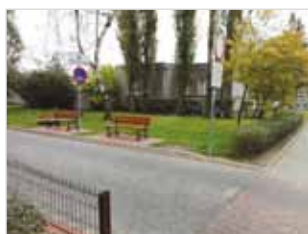
Ryc. 3. Ławka przy ul. Międzynarodowej

Podczas spacerów badawczych zadaliśmy sobie pytanie: „na czym można usiąść w Warszawie?”. Każdy członek zespołu badawczego przespacerował się sam wybraną ulicą, aby zaobserwować miejsca, w których można usiąść, oraz wykonać dokumentację wszelkich form nadających się do siedzenia. Wybrane efekty spacerów badawczych prezentujemy poniżej.