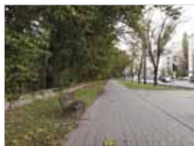
Ryc. 9. Ławki typu warszawskiego przy Al. Ujazdowskich