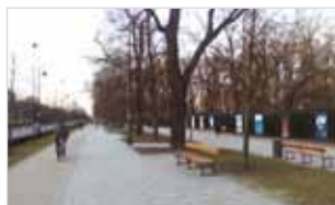
Ryc. 10. Ławki przy al. Waszyngtona