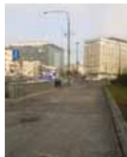
Ryc. 29. Brak miejsc do siedzenia przy ul. Wawelskiej

Większość badanych ulic była pozbawiona ławek, na niektórych występowały pojedyncze ławki, a czasem jedynymi miejscami do siedzenia były te, które umieszczono w wiatach przystankowych lub przy nich. Na ulicach, przy których stały ławki, przeważały formy bez oparcia.