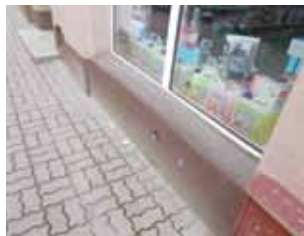
Ryc. 25. Szerszy zewnętrzny parapet, na którym można usiąść, przy ul. Stawki