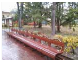
Ryc. 4. Ławka przy ul. Szczęśliwickiej