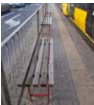
Ryc. 19. Ławki na przystanku tramwajowym przy al. Jana Pawła II