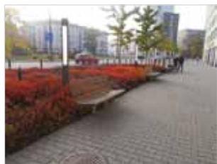
Ryc. 7. Ławki przy ul. Stawki