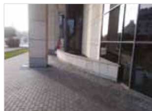
Ryc. 27. Szerszy zewnętrzny parapet przy ul. Muranowskiej