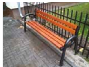
Ryc. 8. Ławka przy ul. Biało-brzeskiej 68