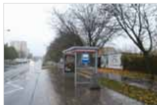
Ryc. 20. Wiata przystankowa z ławką przy ul. Szczęśliwickiej