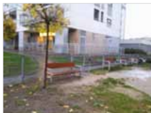
Ryc. 6. Ławki na terenie osiedla przy ul. Szczęśliwickiej