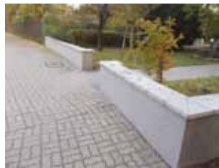
Ryc. 26. Murek, na którym siadają ludzie, przy ul. Stawki