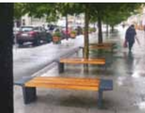
Ryc. 16. Ławki przy ul. Świętokrzyskiej