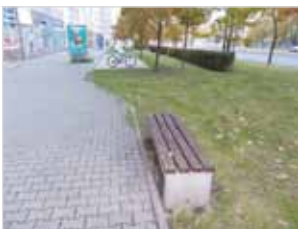
Ryc. 13. Ławka przy al. Jana Pawła II